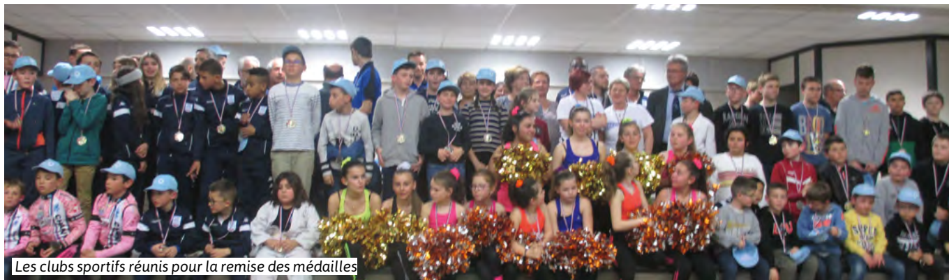
Les clubs sportifs réunis pour la remise des médailles