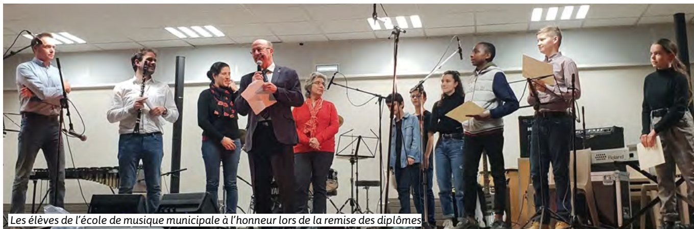
Les élèves de l'école de musique municipale à l'honneur lors de la remise des diplômes