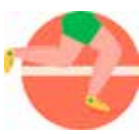
UNION SPORTIVE DU COLLÈGE