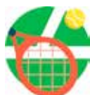
TENNIS CLUB DE CHARVIEU- CHAVAGNEUX