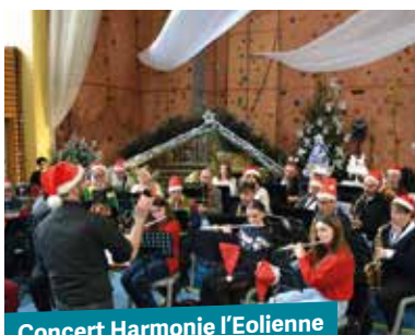
Concert Harmonie l'Éolienne

Les gourmands n'étaient pas en reste, le foie gras et les huîtres proposés par Beauté et Talents, la buvette animée par le SOPCCT Rugby et les marrons et le vin chaud offerts par la Municipalité ont eu un franc succès.