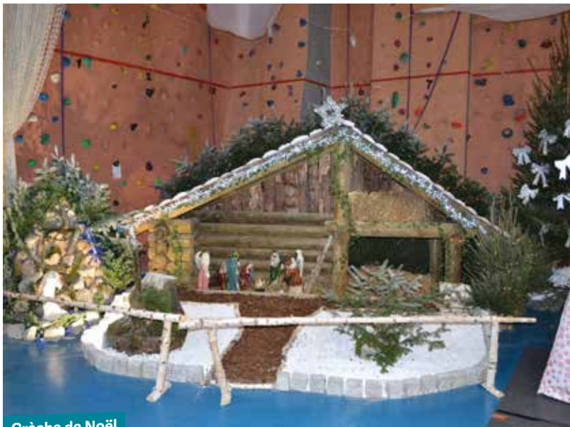
Crèche de Noël

Les 26 et 27 novembre derniers, une foule dense s'est pressée à l'Espace David Douillet pour réaliser des emplettes auprès des 55 exposants présents sur le marché de Noël dont 18 nouveaux artisans et commerçants.