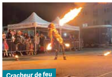
Cracheur de feu