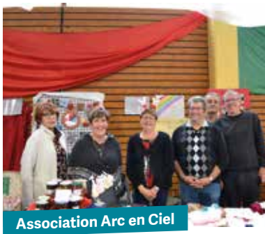
Association Arc en Ciel