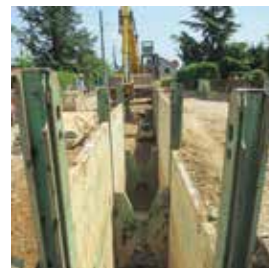
Travaux d'assainissement 307 000 €