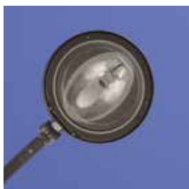
Eclairage public 30 000 €