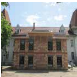
Extension de l'Hôtel de Ville + étude préalable 482 000 €