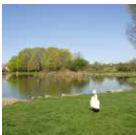
Espaces verts, lac, parcours santé 33 000 €