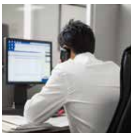
Hôtel de ville, matériel informatique, Police municipale 208 000 €