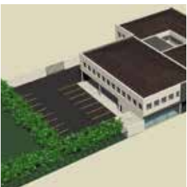
Provisions pour la construction d'une maison médicale 500 000 €