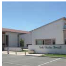
Travaux réalisés dans les bâtiments communaux 328 100 €