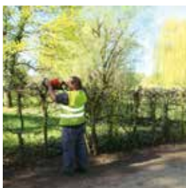
Travaux réalisés par les services techniques municipaux 130 000 €