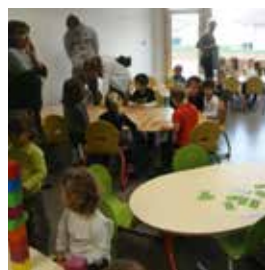
Travaux d'entretien des écoles 360 000 €