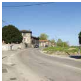
Provisions pour l'aménagement du carrefour des Carabiniers 400 000 €