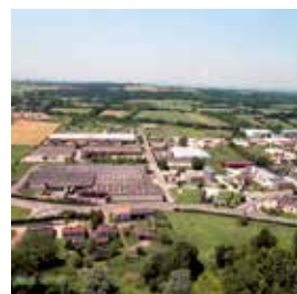
Zone industrielle Montbertrand 10 000 €