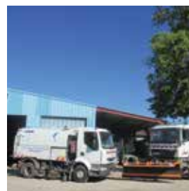
Matériel pour les services techniques 65 000 €