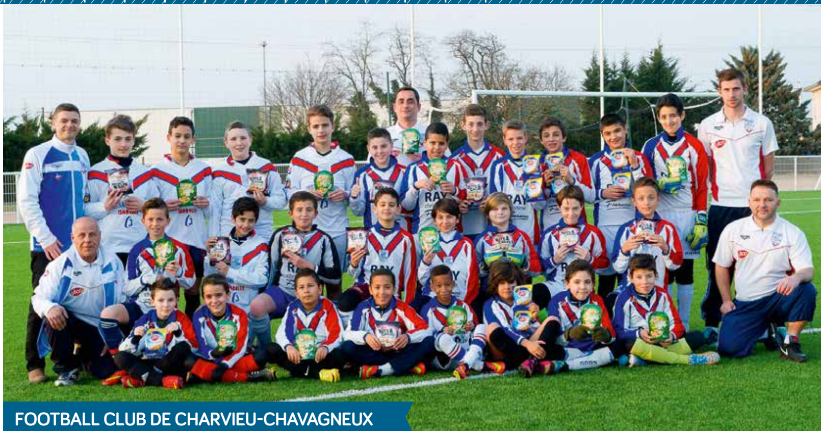
FOOTBALL CLUB DE CHARVIEU-CHAVAGNEUX