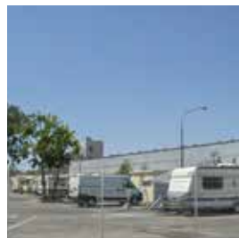
Travaux sur l'aire d'accueil des gens du voyage 25 000 €