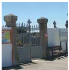
Cimetières 15 000 €