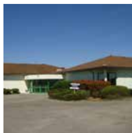
Équipements sportifs, animation et vie associative 122 500 €